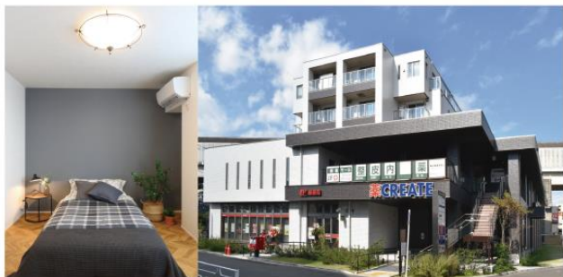
パナソニックホームズ施工 マンション（見学物件）